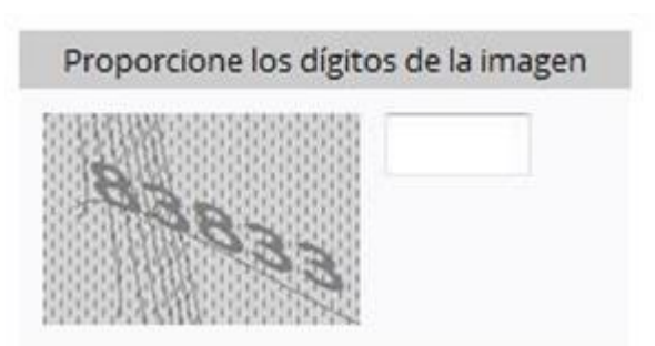
Imagen 2 CAPTCHA (Prueba de Turing pública y automática para diferencial máquinas y humanos, por sus siglas en ingles)

Dígitos Dinámicos o captcha: El captcha (Imagen 2) es un instrumento de seguridad utilizado para corroborar que el usuario del portal es un humano y no un proceso automatizado intruso tratando de obtener información o sabotear la aplicación.